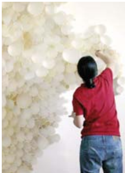
L'artista durante la composizione dell'opera presentata al Premio Arte Laguna

• Viaggio visivo e sonoro dedicato a New Orleans sabato 10 marzo con Radio Gwendalin. Dalle 17 alle 19 speciale live sulla radio per ripercorrere l'evoluzione della musica di New Orleans insieme a Patrick Soergel e Nicolas Gillet ( JazzAscona ); dalle 20.30 alle 22 nel salotto Gwen proiezione del documentario "The Sound After the Storm". La serata proseguirà al Murrayfield Pub di Chiasso con il concerto di The Candyman Quartet (jazz roots, gipsy&swing) e il dj Set.