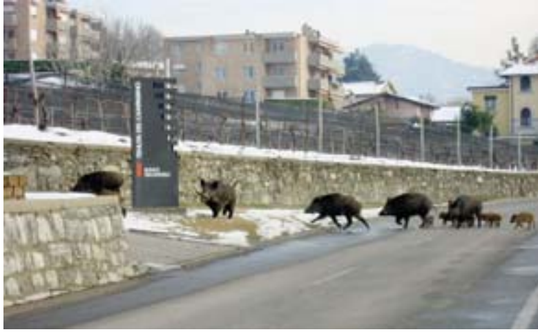
"Oggi dove andiamo? Perché no, facciamoci un giretto fin su alla Basilica" sembrano dirsi questi cinghiali colti ad attraversare in fila ordinata la strada. Sembrano scolaretti ma questi animali - massicci e pronti alla carica - vanno tenuti a grande distanza.