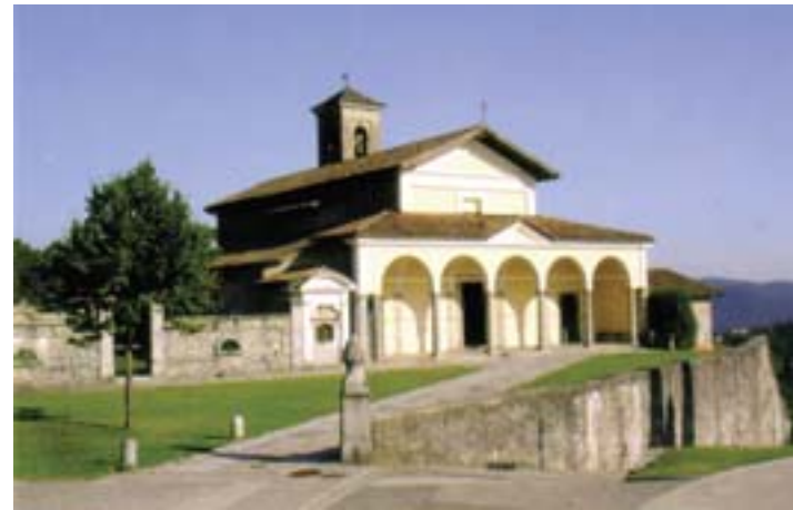
Chiesa parrocchiale della seconda metà del 1500, terminata con l'aggiunta sul finire del 1600 dell'elegante portico a colonne (su disegno di Simone Cantoni di Muggio?) con presbiterio rialzato e coro semicircolare aggiunto verso la metà del 1800 e campanile a sud del coro. La grande funzione della consacrazione avvenne il 26 settembre del 1819. Così secondo la ricostruzione storica della chiesa da parte dell'archivista Luigi Del Bosco.